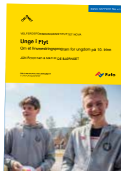
Evalueringsrapporten Unge i Flyt (Nova-rapport nr. 4/21) er utarbeidet av Fafo og Nova. Rapporten kan lastes ned gratis fra oslomet.no .

I beste fall kan Flyt forstås og fungere som en metode for å forebygge prosesser som over tid vil kunne lede til frafall. Analysene i rapporten gir gode resultater. Om det er tilstrekkelig til å snu ungdom på vippen er det imidlertid for tidlig å trekke sikre slutninger om. Frafall måles først fem til seks år etter at de begynte på videregående skole.