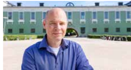
Göran Nygren er forsker ved institutt for kulturanthropologi og etnologi ved Uppsala universitet.

Kvinner utgjør 74,8 prosent av alle ansatte i grunnskolen, 89,4 prosent av ansatte i barnehager og 58,9 prosent av ansatte i videregående skole.